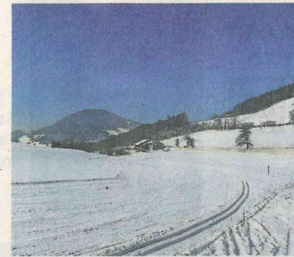
Loipe im freien Gelände.

Langenbruck mit seinem Weiler «Bärenwil» kann man nicht nur auf den Langlaufskiern, sondern auch mit dem Schlitten oder mit Schneeschuhen entdecken. Auch die Wanderer kommen auf den schönen und vielseitigen Wanderwegen in der Winterzeit auf ihre Rechnung. Das gemütliche Restaurant «Chilchli», das den Weiler Bärenwil aufwertet, empfiehlt sich sehr für eine Stärkung nach dem Laufen. (Dienstag und Mittwoch geschlossen). 08Z